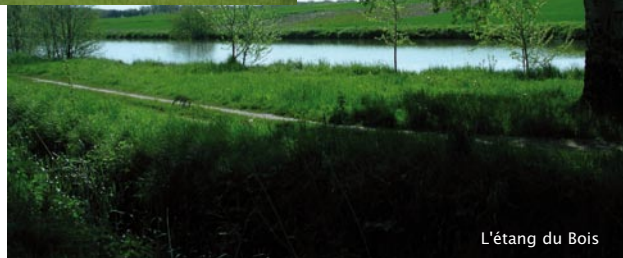
L'étang du Bois