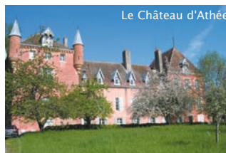
Le Château d'Athée

(1) Au départ (parking, lavoir) depuis le square de l'étang Pontot, prendre à droite le grand chemin de Montarlot (2) belle vue sur l'étang du Moulin et le village de Magny-Montarlot ; (3) tourner à droite pour traverser le village de Montarlot (4) : calvaire indiquant l'emplacement de l'ancienne église ; traverser la départementale et aller tout droit par le chemin du Fiaunai (5) : attention rucher !